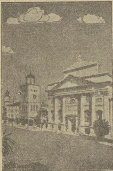
Kościół św. Anny w Warszawie gdzie spoczywa ciało bł. Władysława z Gielniowa.